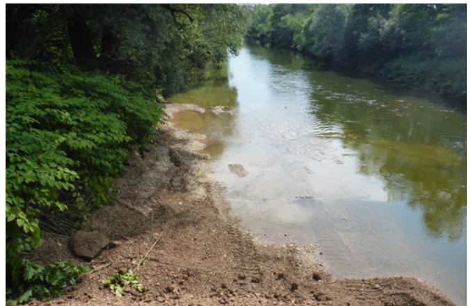
Herstellung eines Kiesdepots am Neckar (links und rechts)