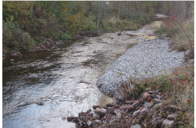
Herstellung von Kiesdepots an der Waldach (links) [Büro Heberle] und an der Elz (rechts) [RP Karlsruhe]