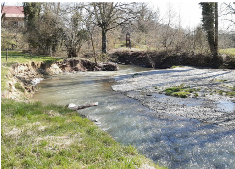
Natürliche Dynamik schafft Kiesstrukturen. Rotach [LRA Bodenseekreis]

Der natürliche Sedimenthaushalt ist in vielen Gewässern gestört. Verbaute Ufer verhindern natürliche Erosionsprozesse, Querbauwerke unterbinden/reduzieren den Sedimenttransport. Eine Aktivierung und Redynamisierung, z. B. durch gezielte Strömungslenkung und Aufweitung des Querschnitts, ist vorrangig umzusetzen.