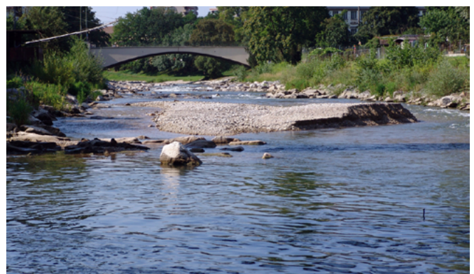
In Gewässermittle angelegtes Kiesdepot

Der Anteil und die Zusammensetzung der dem Gewässertyp entsprechenden Kiesfraktionen sowie die Positionierung im Quer- und Längsschnitt können aus den Referenzstrecken im LUBW-Kartenservice UDO entnommen werden. In mittleren und größeren Fließgewässern sind Kiesbänke mit mindestens der dreifachen Länge der Gewässerbreite anzulegen. In kleineren Bächen sind kleinere Flächen mit einer Länge der einfachen Gewässerbreite in häufigerer Abfolge vorgesehen (weitere Anforderungen siehe Tabelle 1).