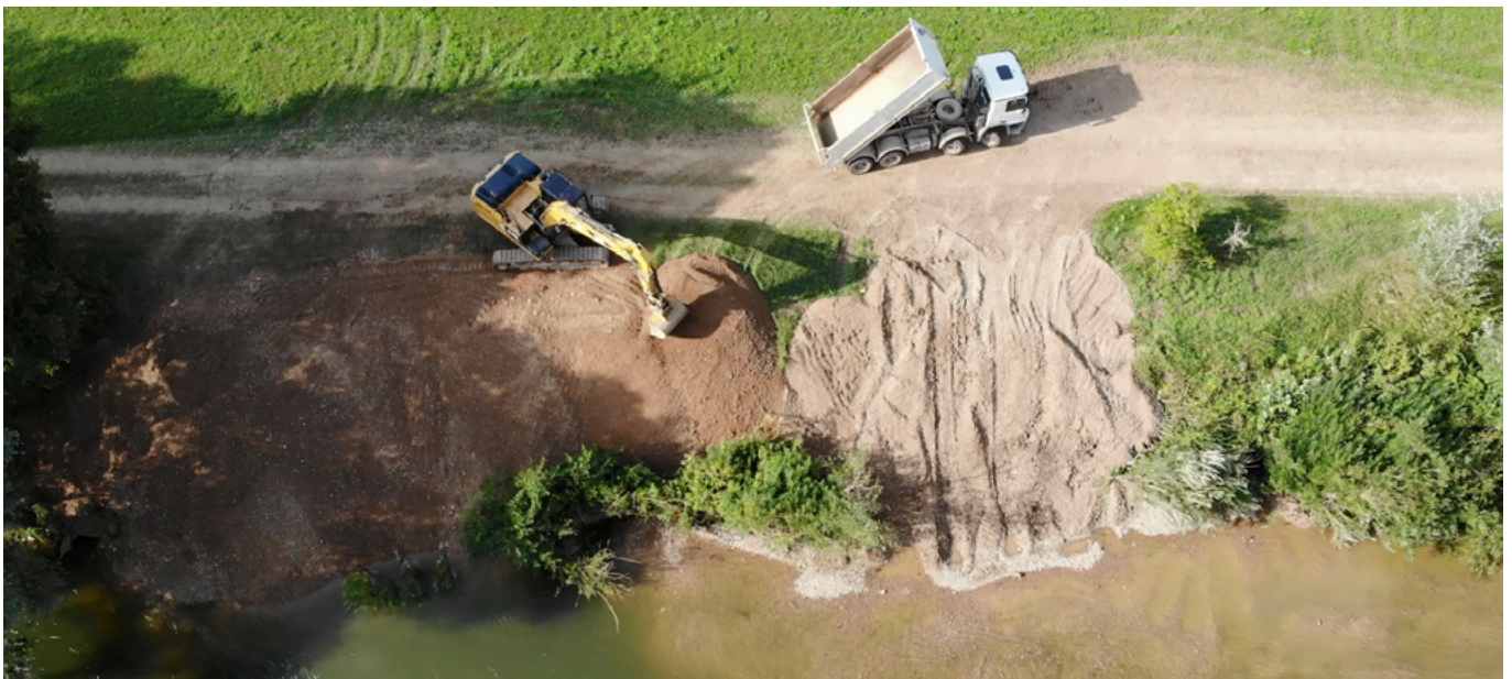
Einbau eines Kiesdepots am Neckar [RP Tübingen]